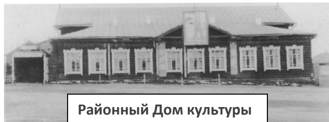
Районный Дом культуры

Много раз библиотеке приходилось переезжать с места на место: с послевоенной поры и до 1960 года она находилась в помещении Дома культуры, заведующей библиотекой с 1957