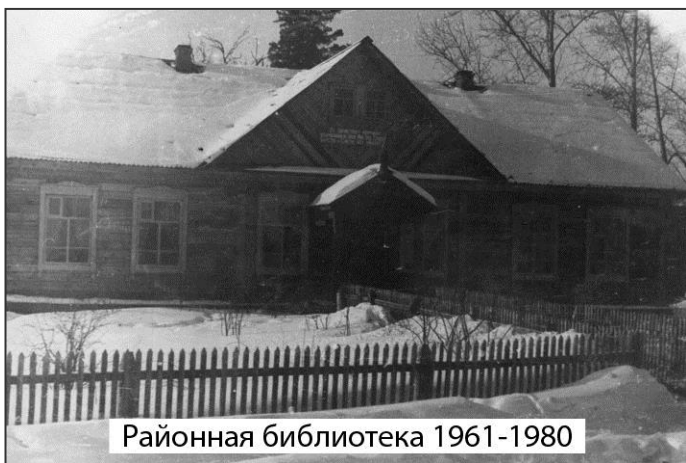
Районная библиотека 1961-1980