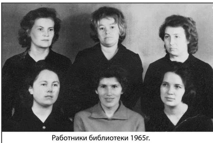
Работники библиотеки 1965г.