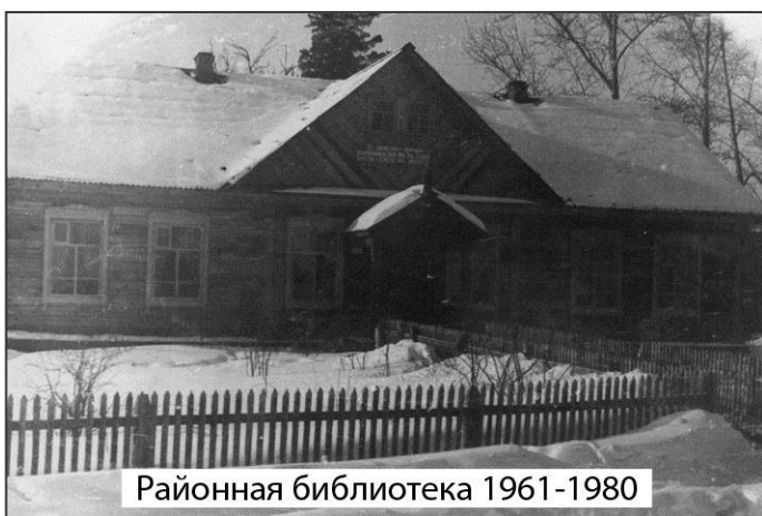
Районная библиотека 1961-1980