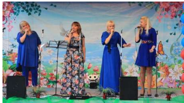
Праздничный концерт «Моя Россия»