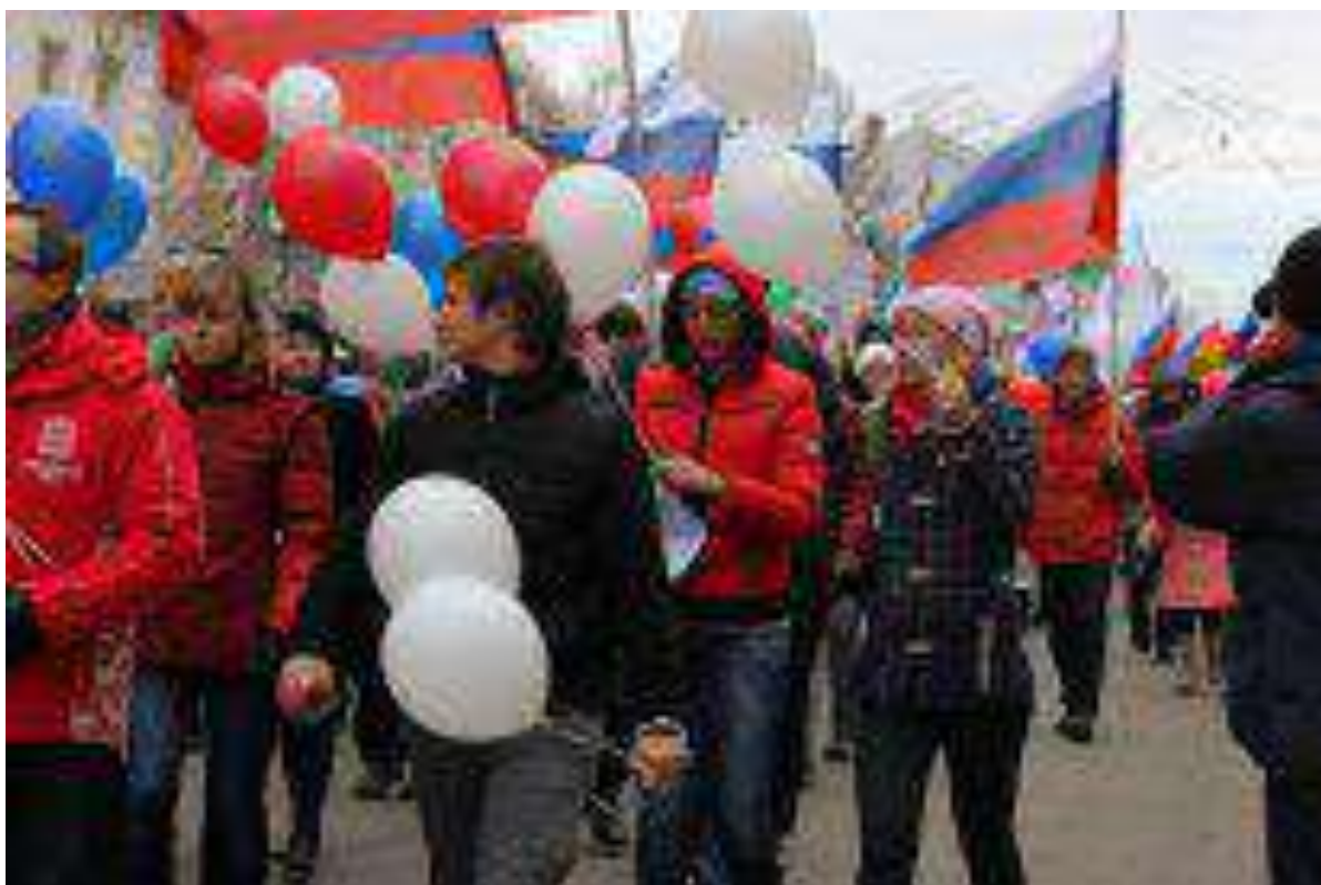
Митинг в День народного единства (с.Шалинское)