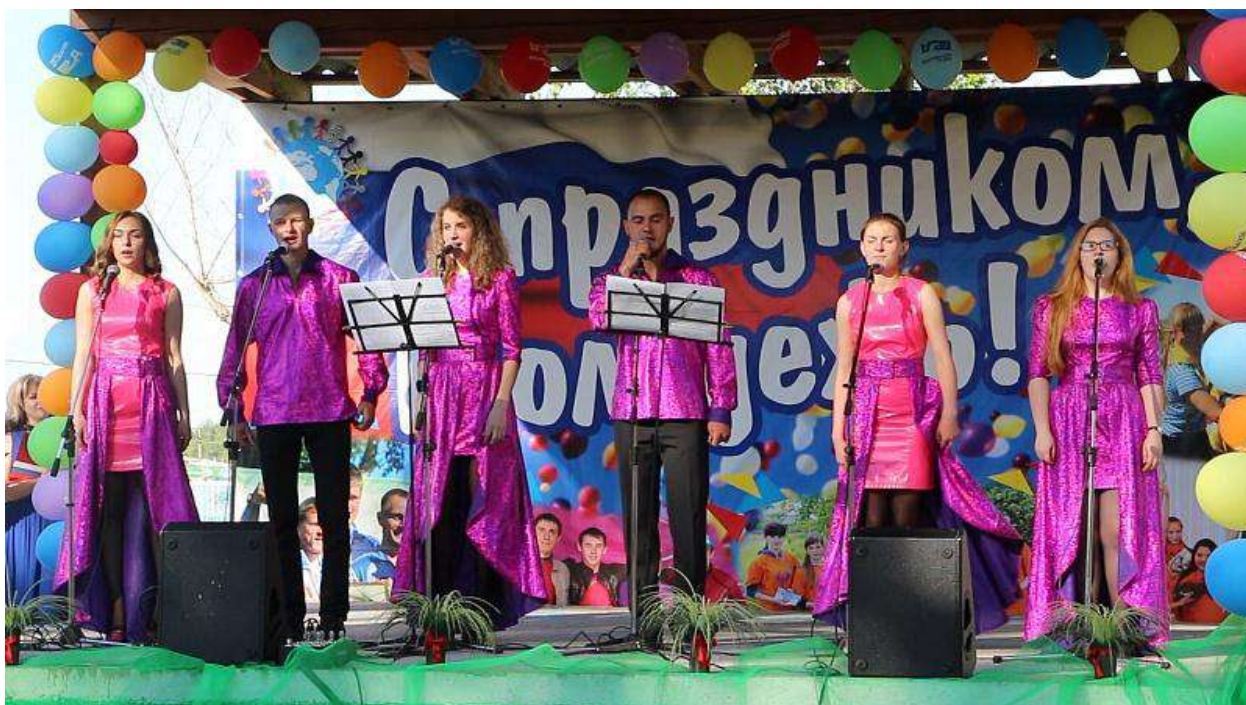
День молодежи в Манском районе