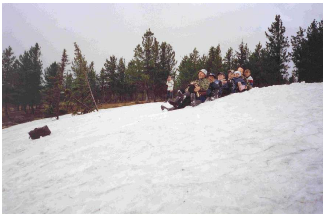
Манская экспедиция на Саянах